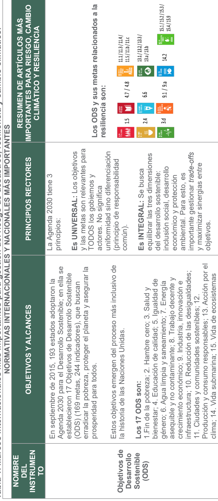
Tabla 1. Marcos internacionales más importantes para gestión del riesgo de desastres, resiliencia y cambio climático. NORMATIVAS INTERNACIONALES Y NACIONALES MÁS IMPORTANTES

El marco legal que se presenta a continuación resume los puntos más relevantes de los instrumentos internacionales más importantes para los temas de gestión del riesgo de desastres, resiliencia y cambio climático. Estos instrumentos establecen los estándares en la materia y han sido todos adoptados y ratificados por México; con lo cual, forman parte del marco legal mexicano. Además, se presenta el resumen de las principales leyes nacionales y generales de la temática.